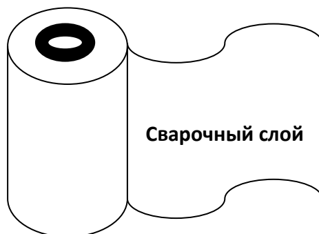
Рисунок 1 - Расположение сварочного слоя пленки Амистайл

Сварочный слой расположен на внутренней стороне полотна пленки.